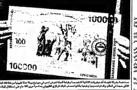
صورة من المعرض الاقتصادي...